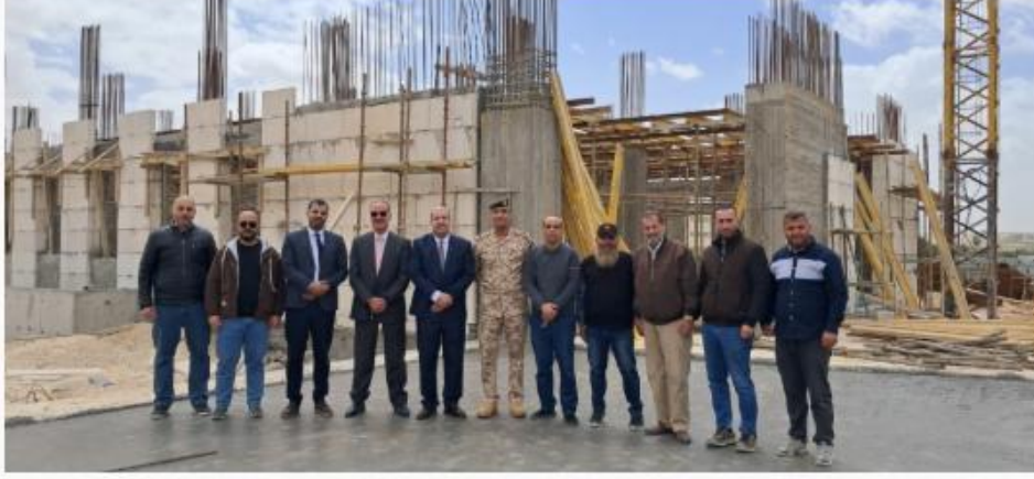
الشريط الإخباري :

خبر و صورة 2026-04-05 | 03:19 pm - الأحد